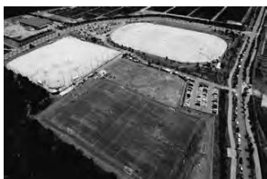
(いきいきパークみさき)

結びに、貴協会の今後、更なるご発展と、選手の皆さまの益々のご活躍を祈念いたしまして、私のお祝いの言葉といたします。