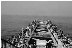
(とっとパーク小島)